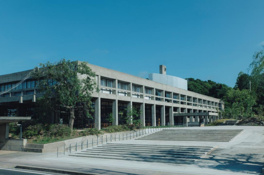
旧上野市庁舎 SAKAKURA BASE (坂倉準三設計) 2階 泊船 HAKUSEN